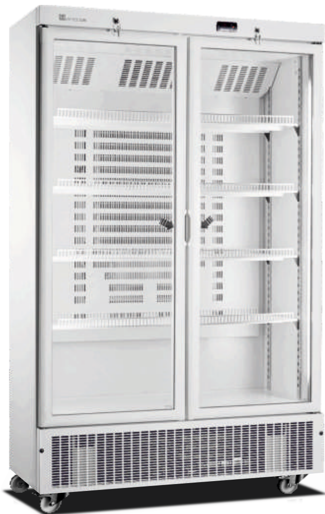
ARV 800 CS PV

Temperatura Funcionamento Temperature Range