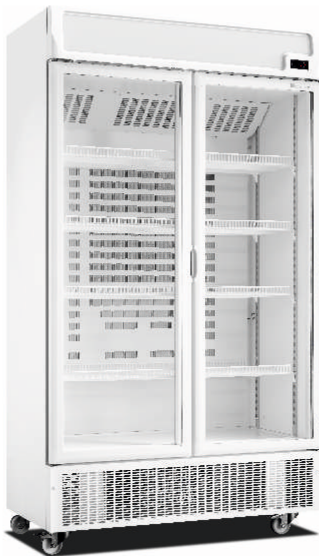
ARV 800 CN PV